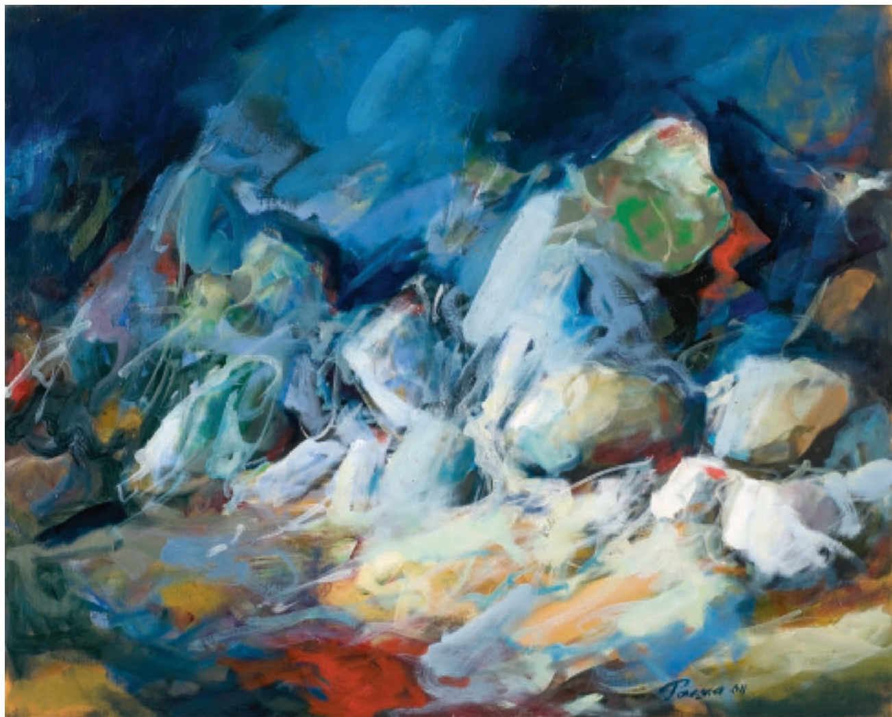
5 USPAVANO KAMENJE, 2011 ulje na platnu, 80×100 cm