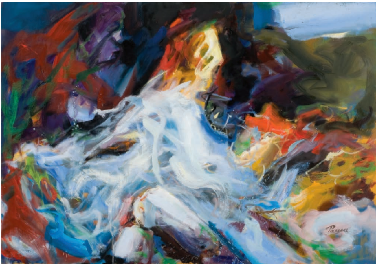
3 DAN KOJI JE PROŠAO ODAVNO, 2011, ulje na platnu, 70×100 cm