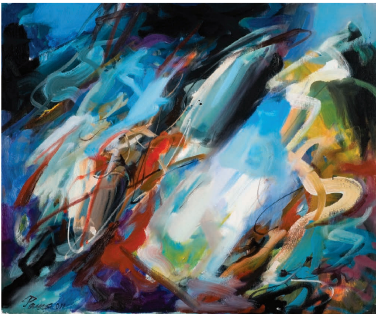
9 POTOK III, 2011, ulje na platnu, 50×60 cm