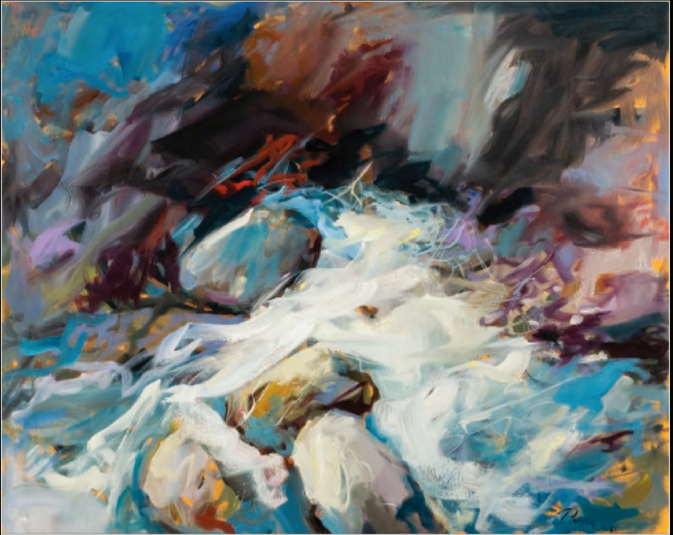
6 TARA, 2011, ulje na platnu, 80×100 cm