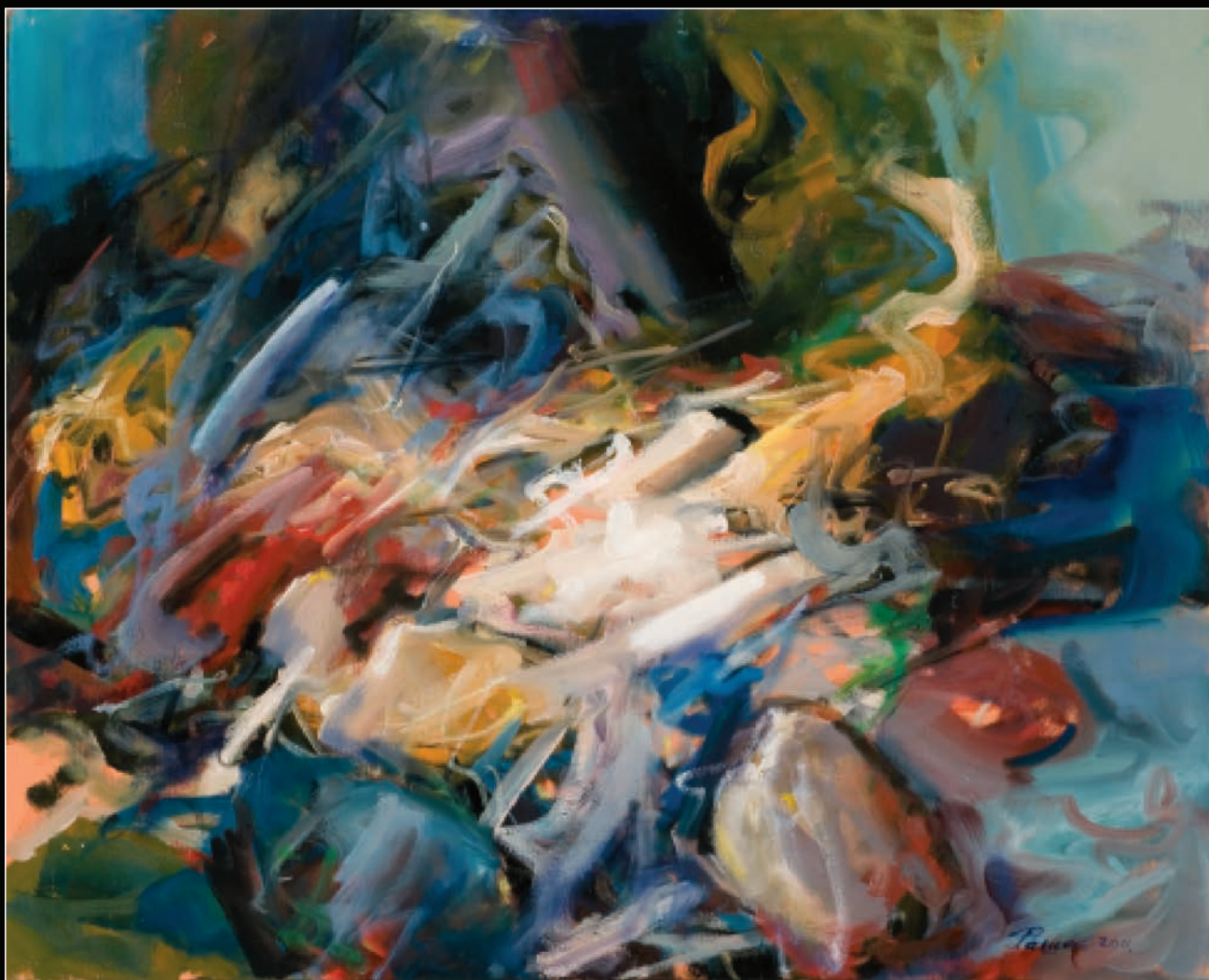
4 PREDEO, 2011, ulje na platnu, 80×100 cm