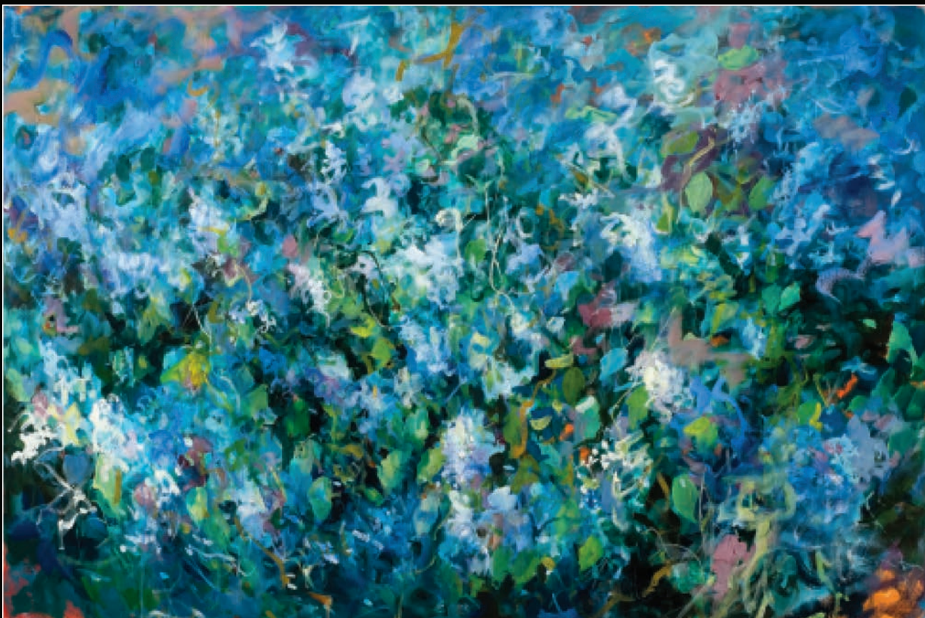
2 PROLEĆE U CVETOJEVCU, 2011, ulje na platnu, 80×120 cm